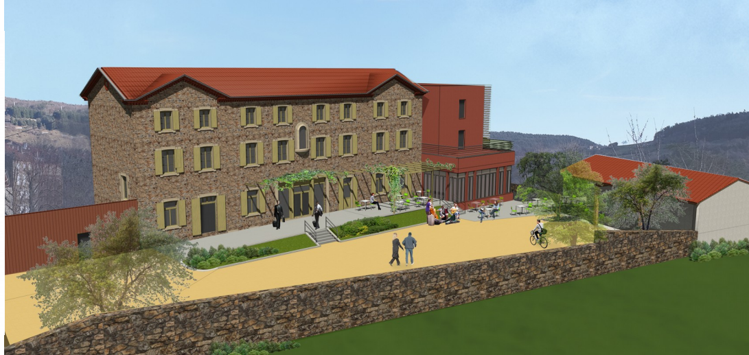
Ouverture printemps 2018

Au cœur de l'Ardèche verte, dans un village authentique, berceau de la course cyclotouristique l'Ardèchoise (16 000 participants), nous proposons la gérance d'un nouvel établissement situé au centre du village de Saint-Félicien, 1000 habitants.